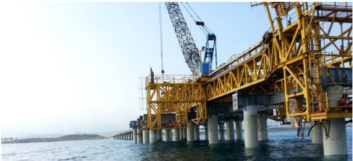
Puerto Brisa Dibulla, La Guajira.

Concreto cumple con la normativa vigente sobre el sistema Gestión del Riesgos, asociados a la corrupción, fraude, soborno, lavado de activos y financiación del terrorismo (LA/ FT), por esta razón, se cuenta con un sistema para la administración de riesgos aprobada por la Junta Directiva a través del Manual para la Prevención de Lavado de Activos y el Protocolo de Riesgo de Fraude y Corrupción, que establecen los lineamientos para los controles de verificación de información, procesos de validación y consultas en listas restrictivas y reportes en fuentes de información pública, con el propósito de proteger el negocio de posibles riesgos relacionados con operaciones inusuales o sospechosas tendientes a servir de instrumento para el ocultamiento, manejo, inversión o aprovechamiento en cualquier forma, de dineros o bienes provenientes de actividades ilícitas.