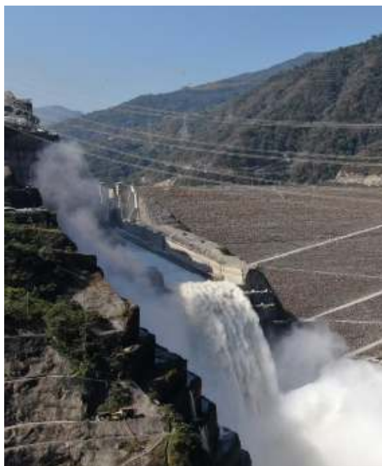
Hidroituango Ituango, Antioquia

Durante la reunión ordinaria de la Asamblea General de Accionistas de la Compañía llevada a cabo el 26 de marzo de 2021, la cual se llevó a cabo bajo el mecanismo de reunión no presencial, mediante el empleo de plataformas digitales y en cumplimiento del Decreto 398 de 2020, donde se aprobó el informe de Gestión en sostenibilidad, el Informe de Gobierno Corporativo y los estados financieros de la Sociedad con corte a 31 de diciembre de 2020, así mismo, se procedió a la designación de la Junta Directiva y Revisor Fiscal para el período de abril de 2021 a marzo de 2023.