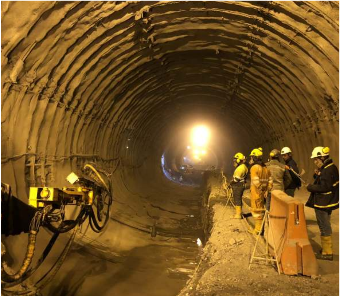
Terminación túnel de La Línea. Calarcá, Quindío - Cajamarca, Tolima

Durante 2021 la Compañía no readquirió acciones propias.