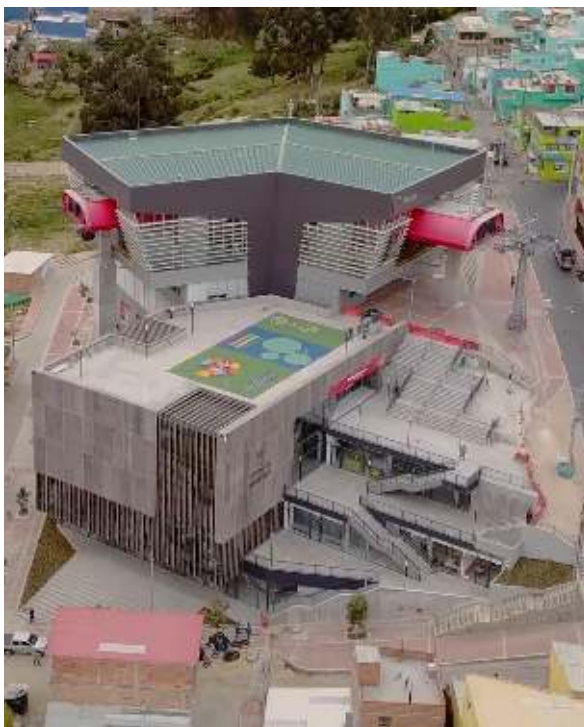
Supercade Manitas. Bogotá, Cundinamarca.