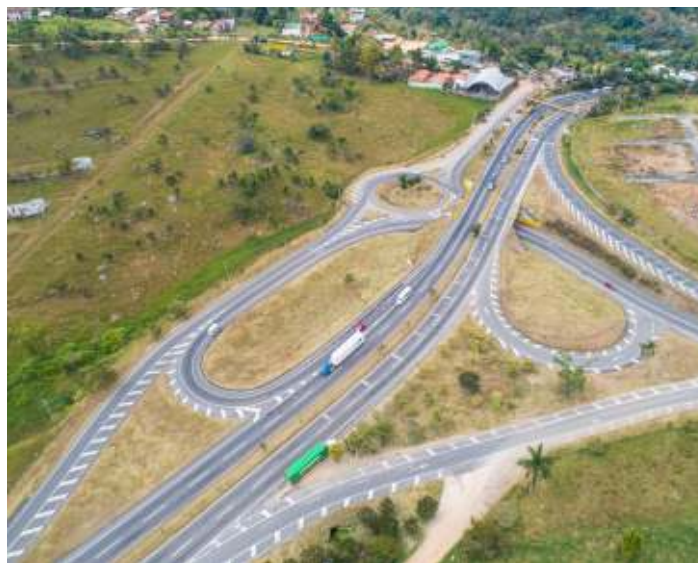
Concesión Vía 40 Express. Bogotá - Girardot, Cundinamarca

La Junta Directiva deliberará y decidirá válidamente con la presencia y los votos de la mayoría de sus miembros. Así mismo, a las sesiones podrán invitarse directivos y funcionarios de la Sociedad u otras personas cuya presencia se considere conveniente para el adecuado tratamiento de los asuntos sometidos a la consideración de la Junta Directiva, si así lo dispusiere el Presidente de la Junta Directiva o el Presidente de la Sociedad.