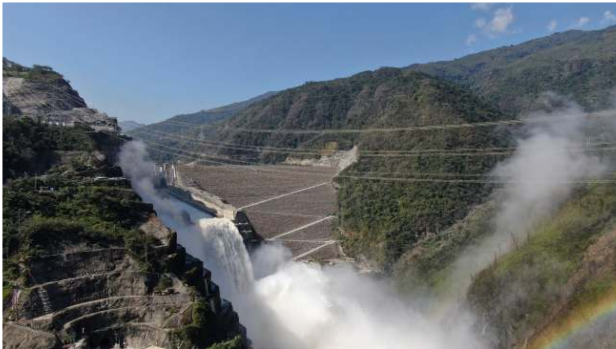
Hidroituango, Antioquia. Obra construida en consorcio para EPM