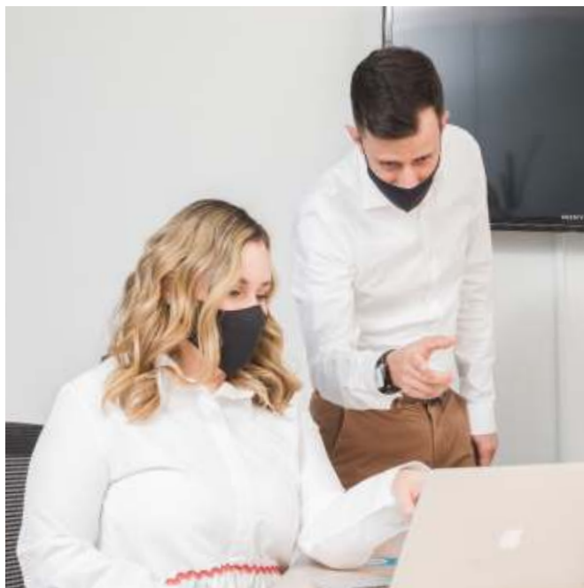
Colaboradores Concreto. Medellín, Antioquia.

Se propuso por los miembros formalizar en un documento donde consten los resultados de las sesiones de autoevaluación y posteriormente convocar a una sesión especial de cierre con la junta en pleno para retroalimentación del documento.