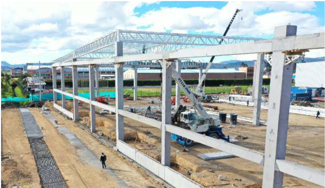
Sistema de conexión de viga prefabricada. Proyecto Lógica Siberia, Cundinamarca.

Nacido en 1969, es abogado de la Pontificia Universidad Javeriana y máster en Filosofía del Boston College. A la fecha se desempeña como Presidente de la Asociación Colombiana de Gas Natural - Ministerio de Minas y Energía y como Presidente de la Agencia Nacional de Hidrocarburos. Participa actualmente en las juntas directivas de Isagen, Tuscany Drilling y Frontera Energy.