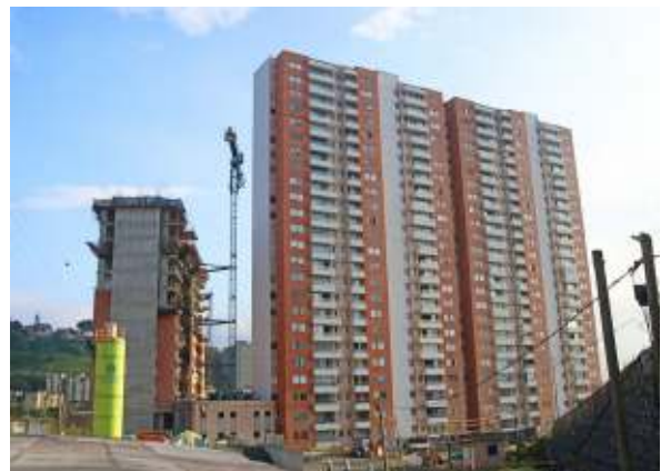
Zanetti Apartamentos. Itagüí, Antioquia.