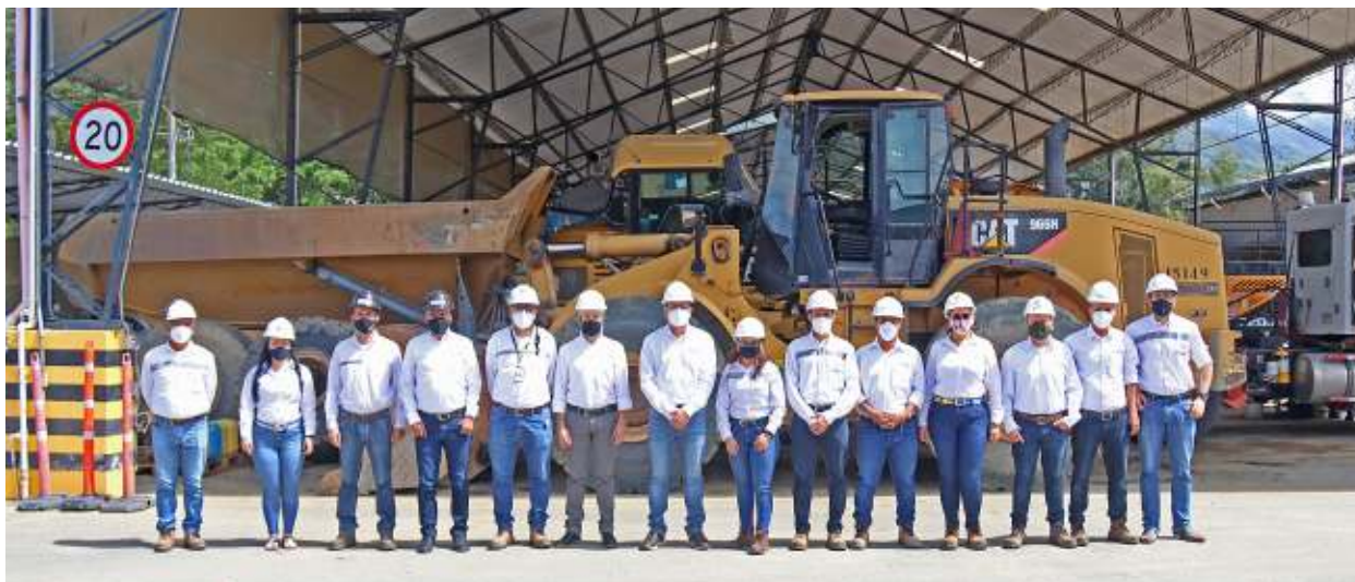
Colaboradores Equipos Concreto. Girardota, Antioquia.