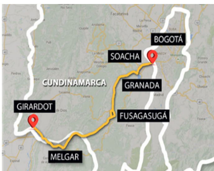
Este es el trayecto de la vía Bogotá- Girardot